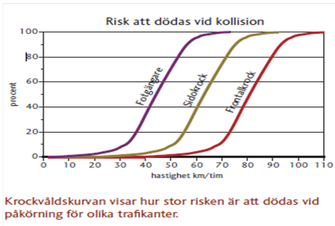
Figur 1. Krockvårdskurvan visar hur stor risken är att dödas vid påkörning för olika trafikant (SKLs "Rätt fart i staden")