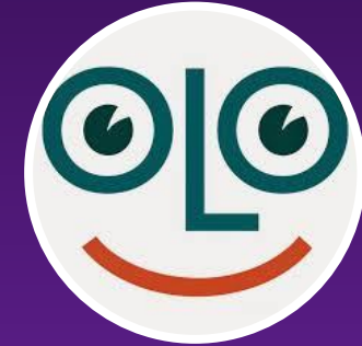
Skolon E-läromedel Digitala lärresurser