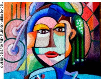
© ALIRO DELGADO FUENTALBA OCH ANNAS SANDELL