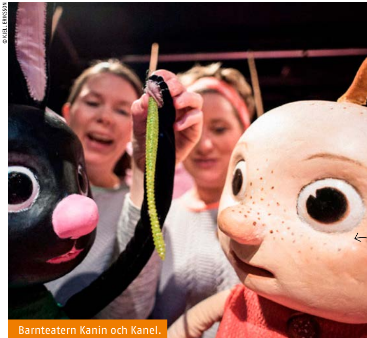
Barnteatern Kanin och Kanel.