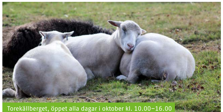
Torekällberget, öppet alla dagar i oktober kl. 10.00-16.00