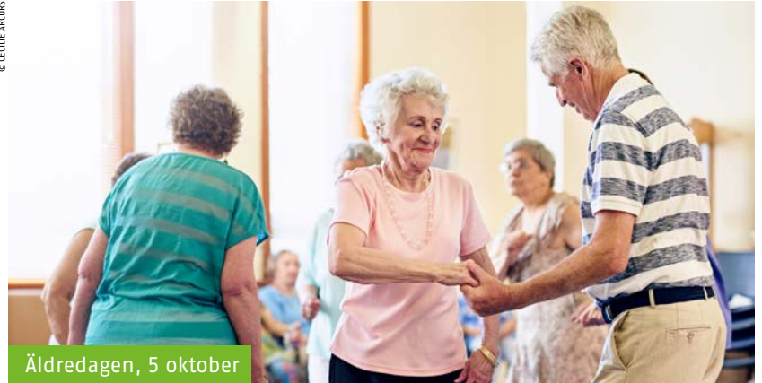
Äldredagen, 5 oktober