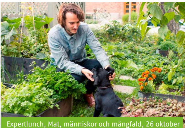
Expertlunch, Mat, människor och mångfald, 26 oktober