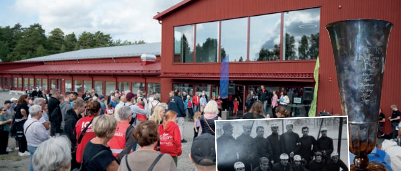
Järna SK kommer firas på Järnadagen 14 september.