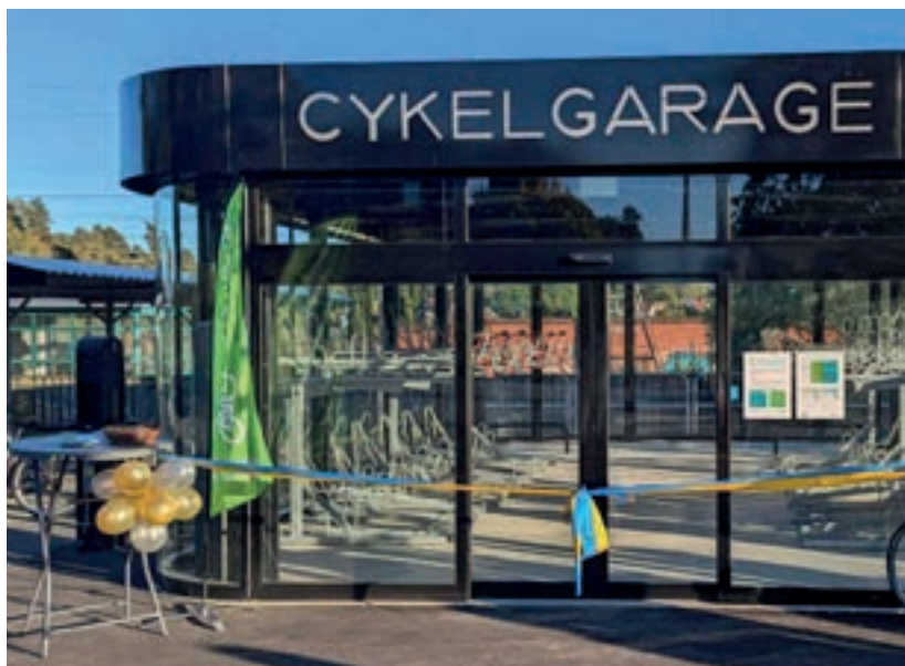
Cykelgaraget vid Järna station invigdes i september.