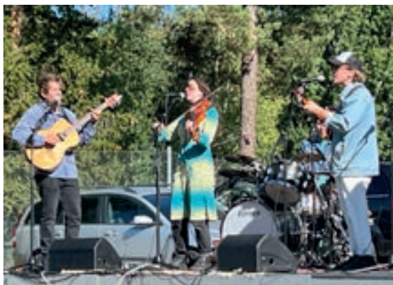
Kolonien stod för musikunderhållningen.

Denna dag visade föreningen upp sin bredd och vilja att fortsätta utveckla sitt utbud genom de möjligheter de nya lokalerna i Rörelsecentrum ger.