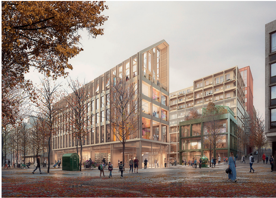
C.F. Möllers vinnande förslag, "Himlen är vårt tak."