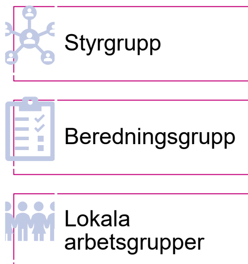
Figur: Överblick organisation God och nära vård i Södertälje

Säker hemgång, palliativ vård och omsorg och samverkan kring obesitas för barn är exempel på områden där gemensamt arbete pågår.