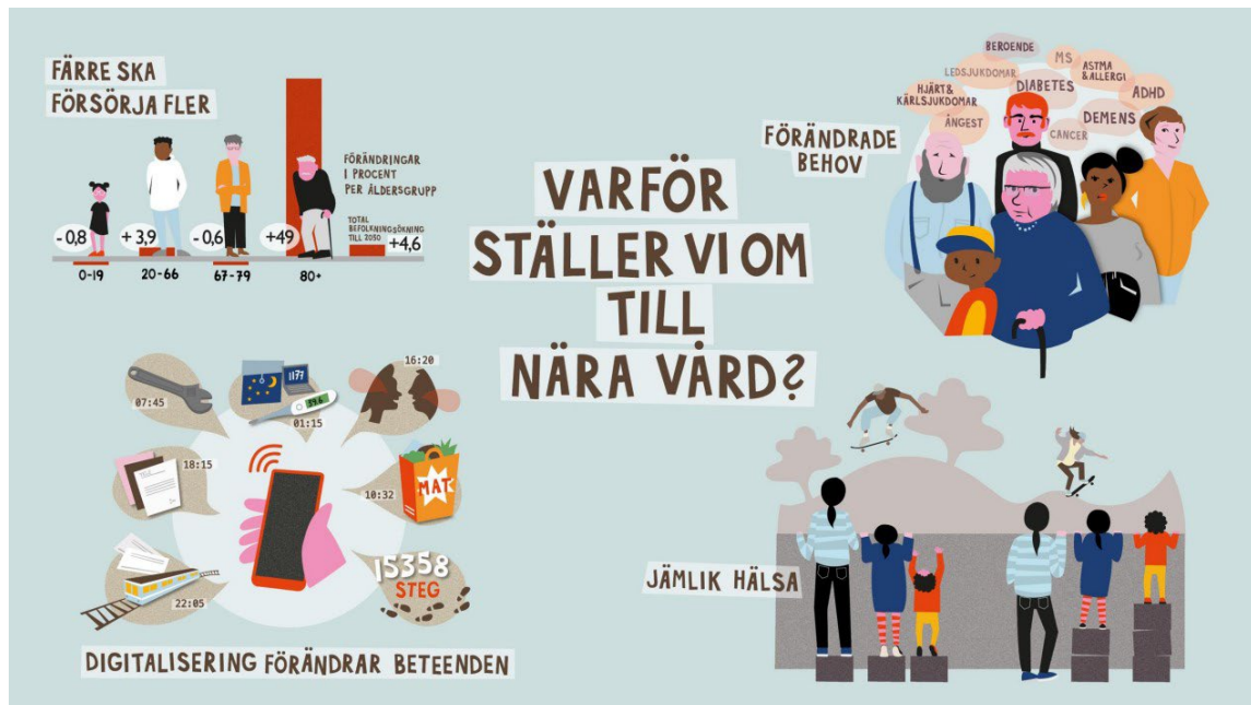
Figur: Nära vård, SKR 2024

medellivslängd. Särskilt utsatta verkar kvinnor vara, där medellivslängden inom gruppen har minskat på nationell nivå sedan 2006. För att nå de övergripande målen för folkhälsa behöver insatser göras för att ge jämlika villkor med särskilt fokus på de som mest behöver det. I Södertälje är diabetes och fetma hos barn ett fokusområde. Ungefär 1 av fem barn till föräldrar med förgymnasial utbildning lever i en familj som inte har råd med nödvändiga utgifter. Det är i sin tur faktorer som påverkar framtida möjligheter till en god hälsa.