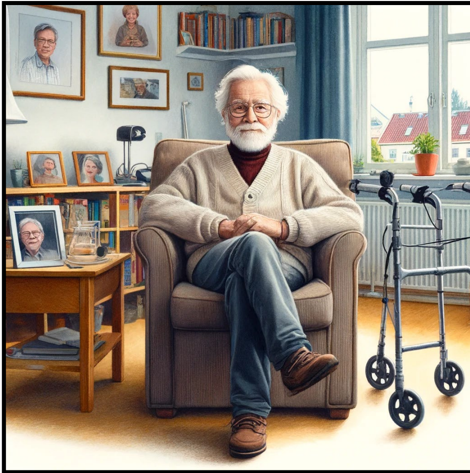
Figur: Ragnar, en fiktiv 83-årig Södertäljemedborgare, AI-genererad bild.

Ragnar har hjärtsvikt och insulinbehandlad diabetes med bensår som han regelbundet följs upp för på vårdcentralen. Han har behövt läggas in på Södertälje sjukhus vid tre tillfällen det senaste halvåret för försämring i sin hjärtsvikt och på grund av instabilt blocksocker.