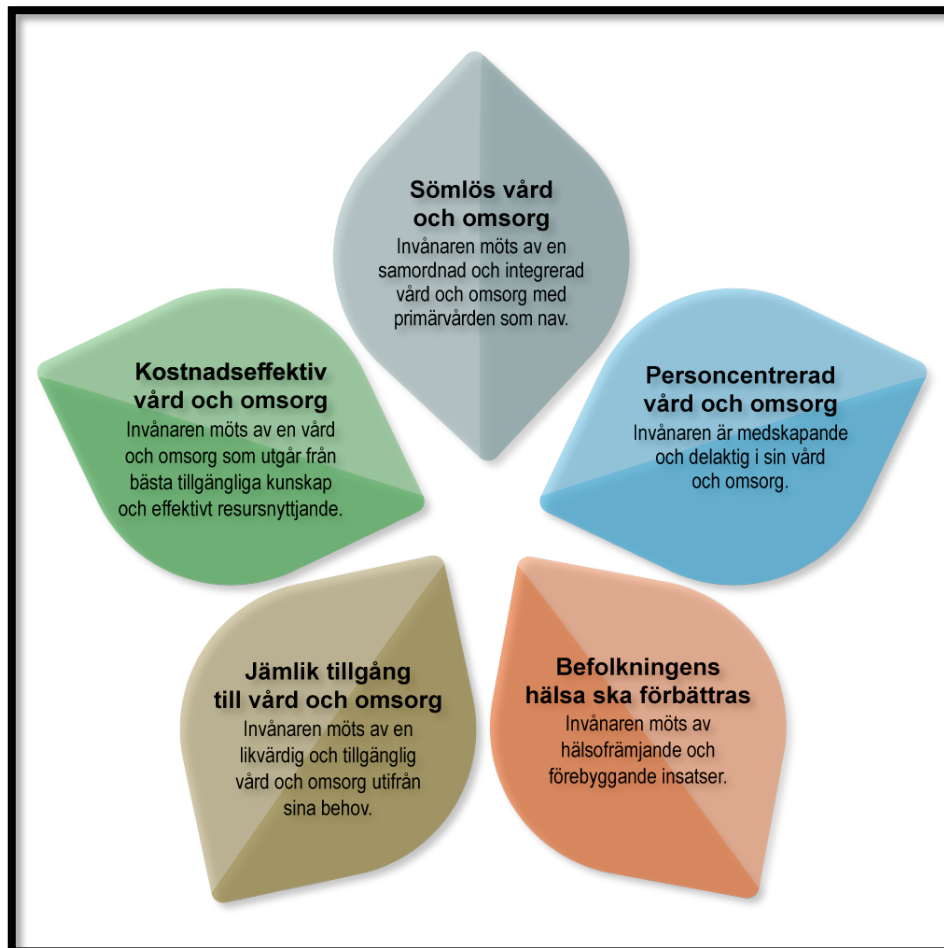
Figur: De fem prioriterade länsövergripande målen Källa: Handlingsplan för god och nära vård och omsorg i Stockholms län 2024-2030.

Det övergripande målet med samverkan mellan regionen och kommunerna är att den enskilde ska få en god, sömlös och personcentrerad vård och omsorg, samt att befolkningens hälsa ska förbättras. Det ska ske på ett samordnat, jämlikt och kostnadseffektivt sätt för invånarna i Stockholms län.