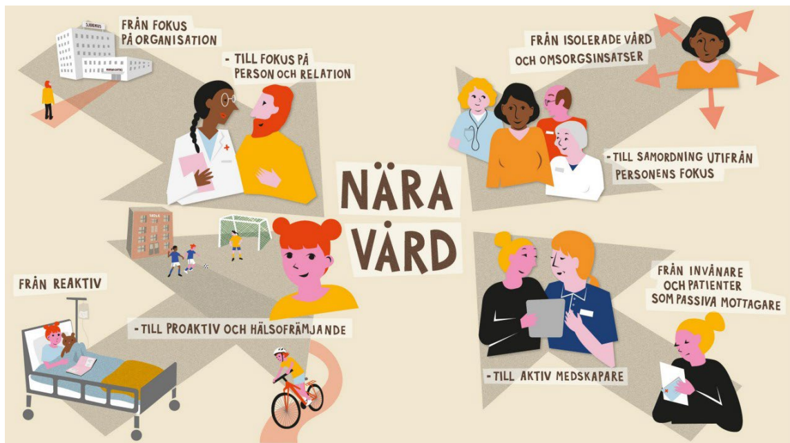
Figur: Nära vård, SKR 2024

En mer tillgänglig, närmare vård kan tillsammans med nya arbetssätt i vården innebära att resurserna inom vård och omsorg kan användas bättre och därmed räcka till fler. Kärnan i nära vård är ett personcentrerat arbetssätt som utgår från individens behov och förutsättningar. Det innebär att se, involvera och anpassa insatserna efter vad som är viktigt för just den personen. 1