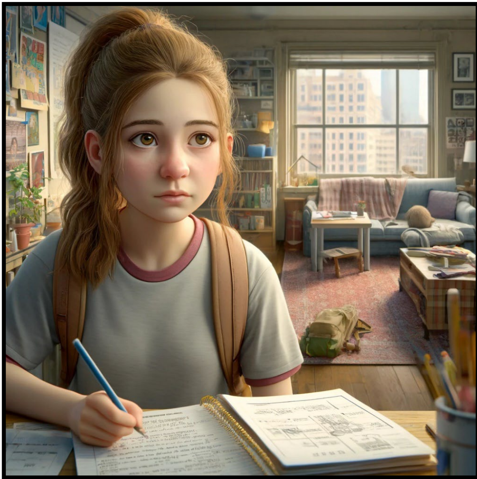
Figur: Hilda, en fiktiv 10-årig Södertäljemedborgare, AI-genererad bild

Hilda är en flicka på 10 år. Hon går 4:e klass. Hon bor med sin mamma, pappa och storebror i en lägenhet i staden. Hon har haft utmaningar i skolan en längre tid, kommer lätt efter och har svårt i kamratrelationer. Skolan har initierat en remiss till primärvården som gör en första bedömning av vilken hjälp Hilda kan behöva tillsammans med familjen. Barnpsykologen ser att det kan finnas behov av vidare utredning på Barn- och ungdomspsykiatri då man misstänker att Hilda har någon typ av neuropsykiatrisk funktionsnedsättning. Då väntetiden på utredningen är lång och Hilda har hög skolfrånvaro har skolan gjort en orosanmälan till socialtjänsten. Socialtjänsten träffar familjen som berättar att Hilda mår dåligt och att det är svårt att motivera henne till skolan, det blir ofta mycket bråk på morgnarna och på söndagskvällarna när Hildas ångest inför skoldagen ökar.