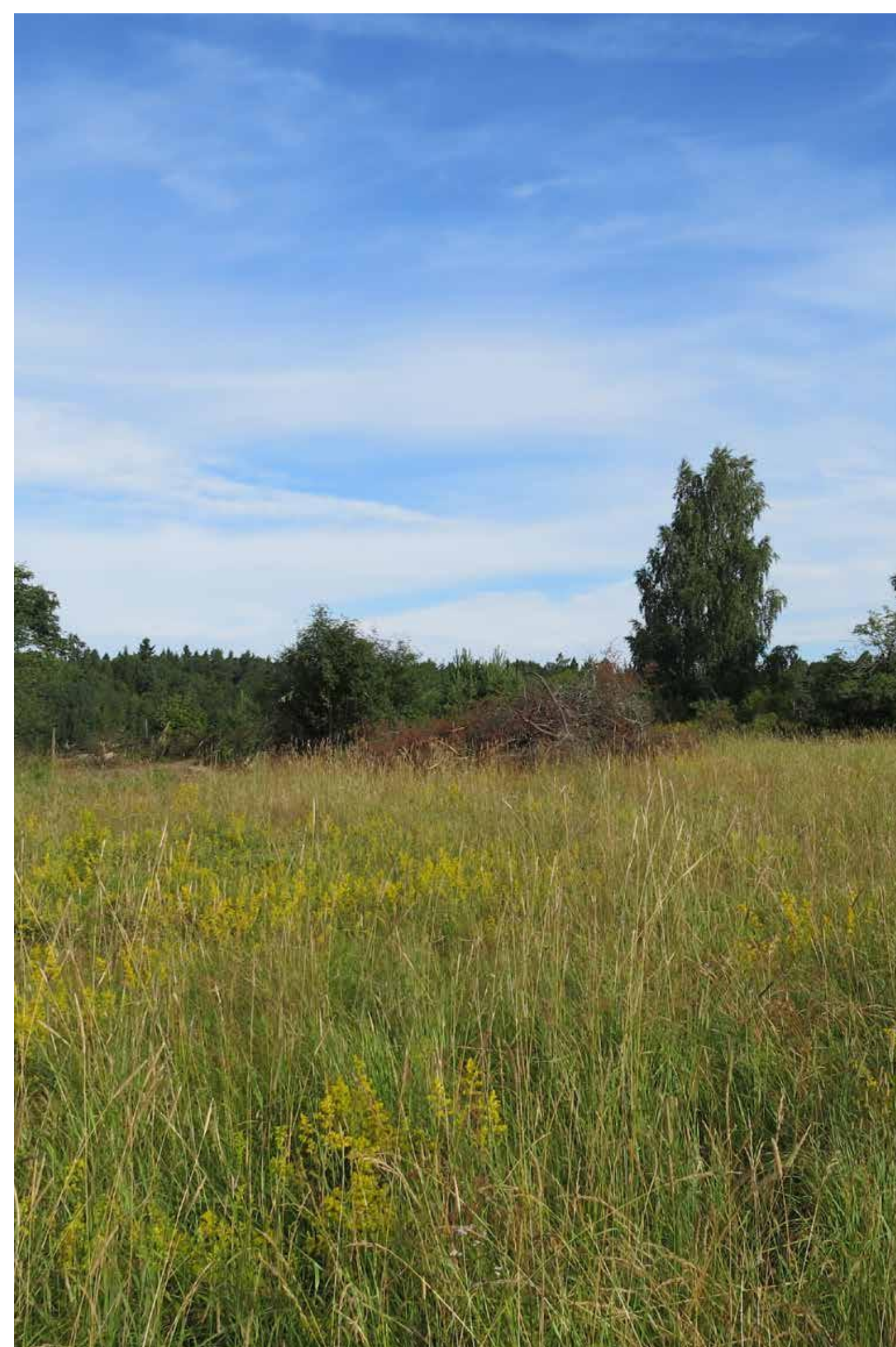
Fig. 9. Arkeologisk undersökning. Arninge, Täby kommun.