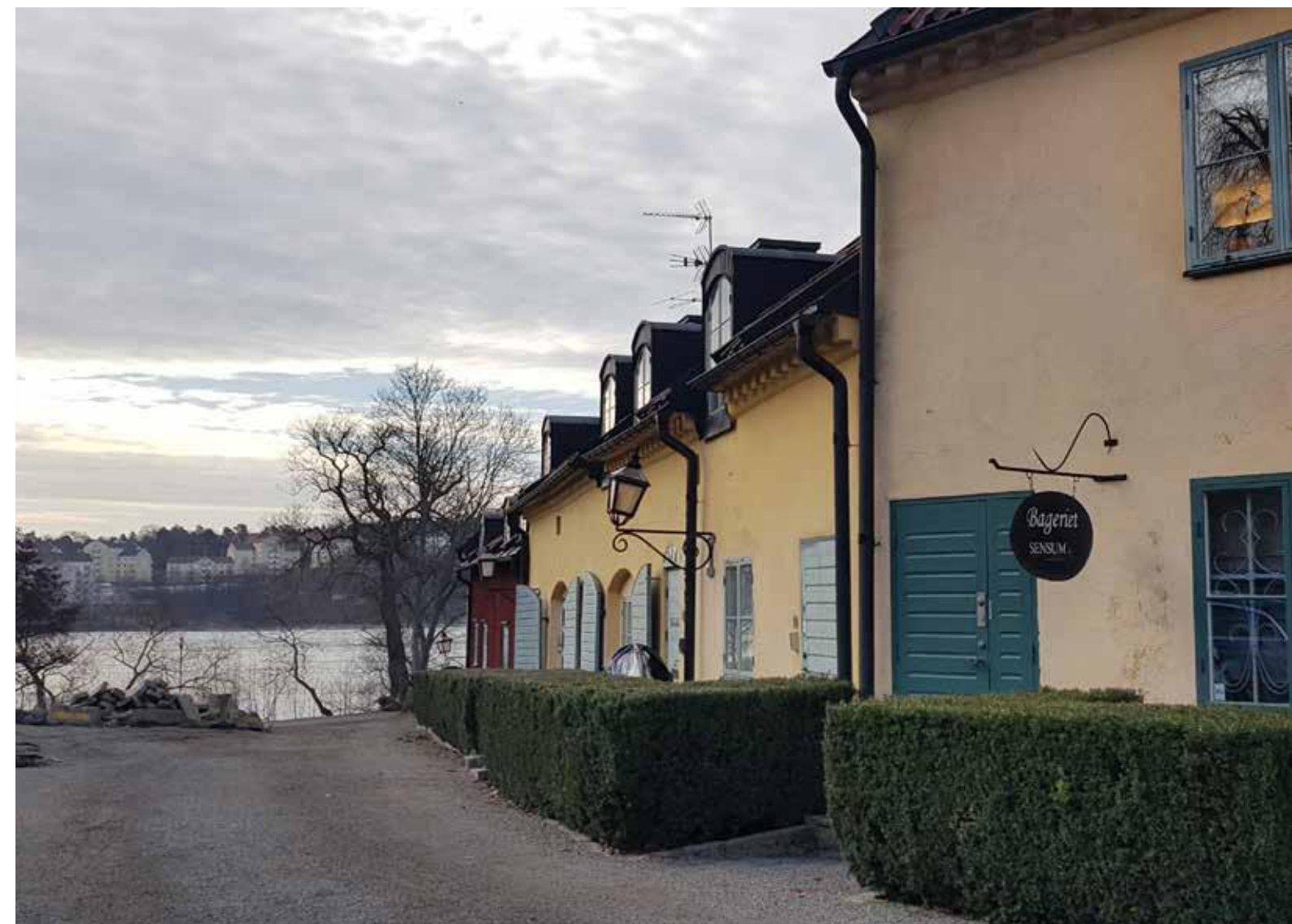
Fig. 1. Solna.