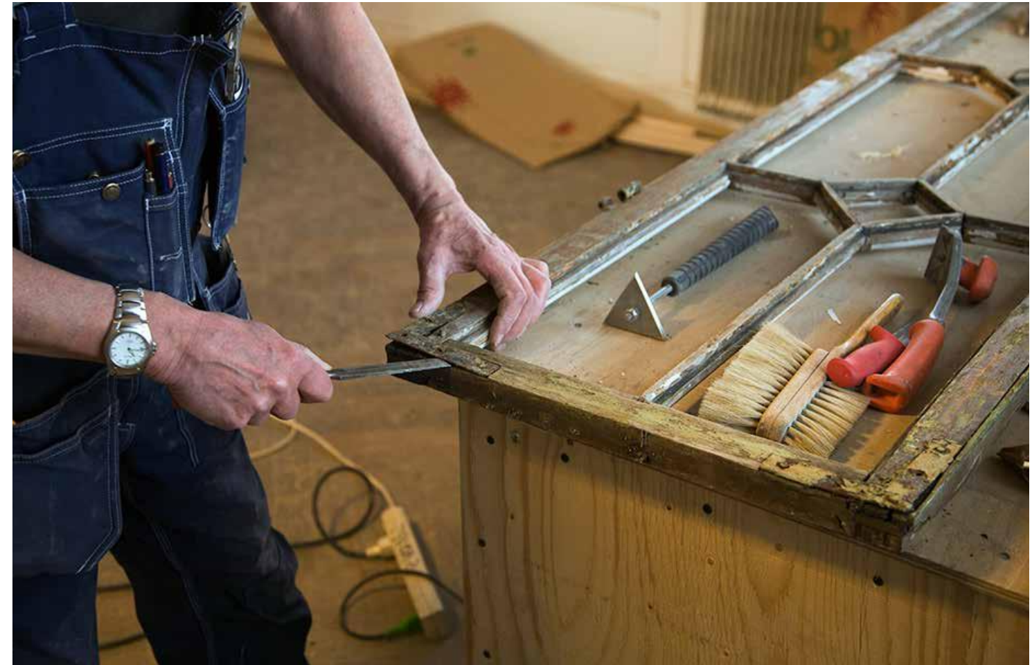
Fig. 12. Fönsterrenovering.

Litteratur: RAÄ – Fem pelare vägledning till god byggnadsvård finns att ladda ner på RAÄ:s hemsida. http://samla.se/xmlui/handle/raa/277