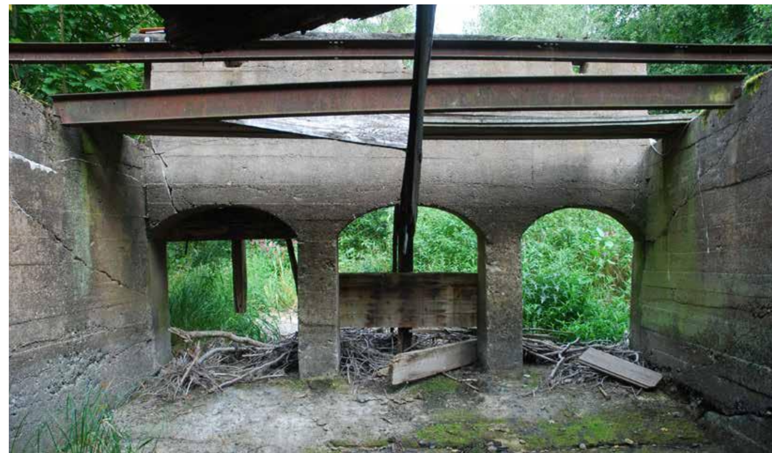
Fig. 7. Karlösa kvarn, Norrtälje.

kommer att påverka skogen. Särskilt värdefulla områden ska skyddas mot ingrepp och andra störningar. Läs mer: http://www.sverigemiljomal.se/miljomalen/