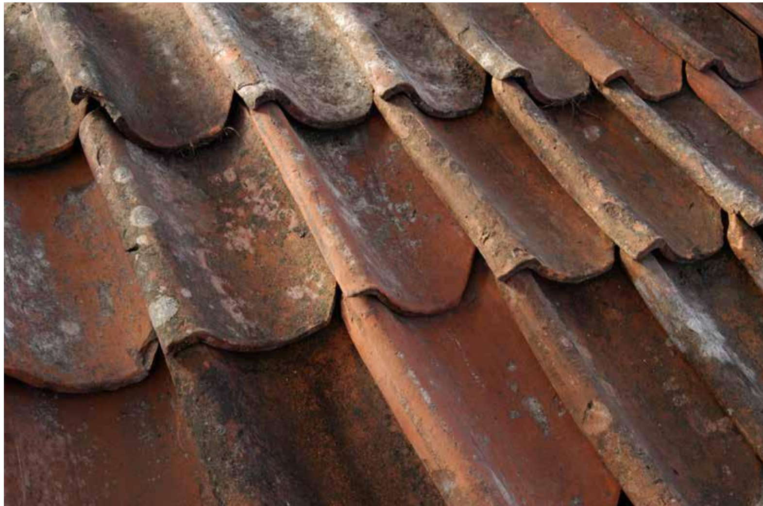
Fig. 11. Enkeltkupigt taktegel, Åsöberget.