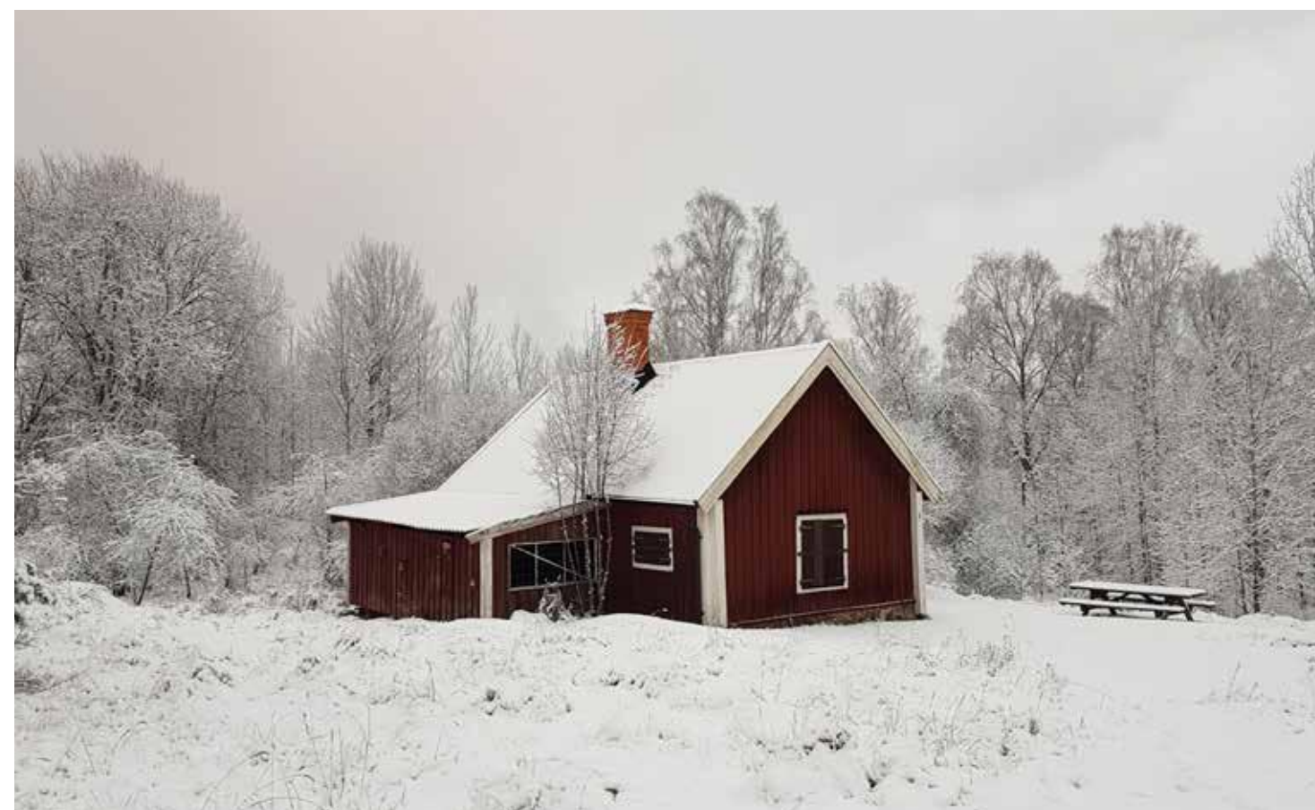
Fig. 6. Ekonomibygnad.