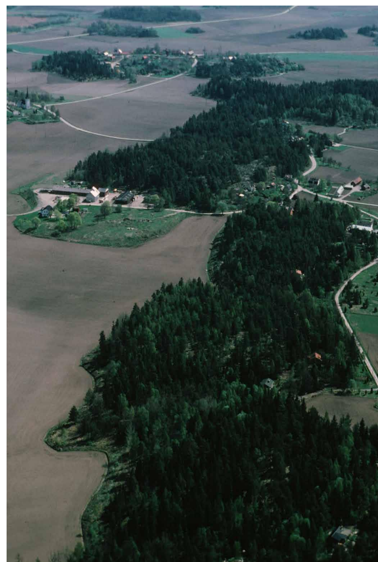
Fig. 2. Flygbild över Igelviken.