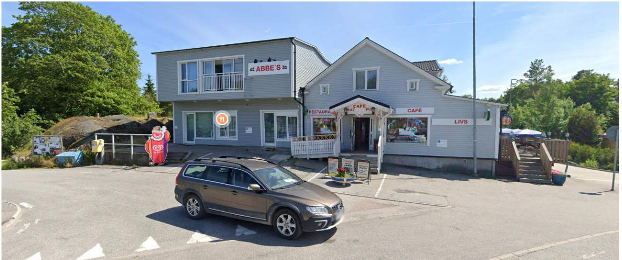
Befintlig restaurang i Mölnbo som erbjuder mycket begränsat utbud av livsmedelsartiklar. Restaurangen ligger intill pendeltågsstationen.

efterfrågan och ge bättre befolkningsunderlag för service. För orten långsiktiga attraktivitet är det därför av intresse att undersöka om det kommer att finnas förutsättningar för en dagligvarubutik i området med möjligheter till omkringliggande service, som exempelvis paketutlämning och apotek.