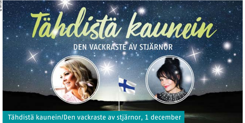
Tähdistä kaunein/Den vackraste av stjärnor, 1 december