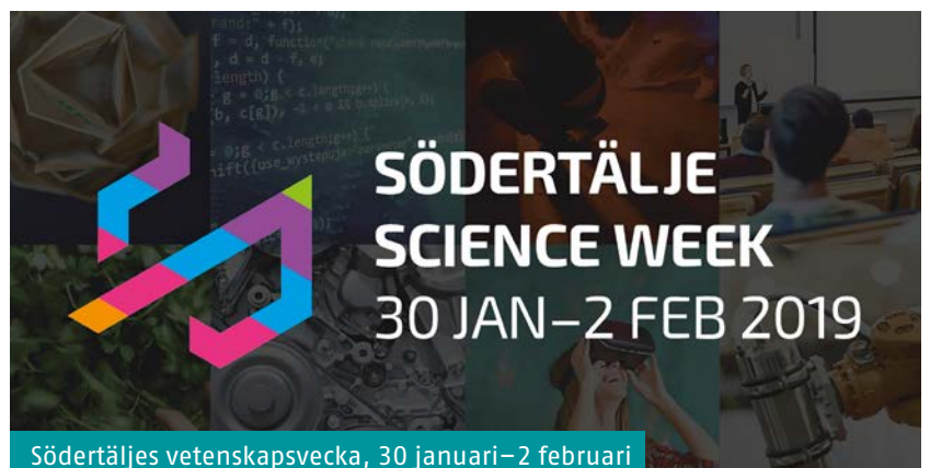
Södertäljes vetenskapsvecka, 30 januari–2 februari