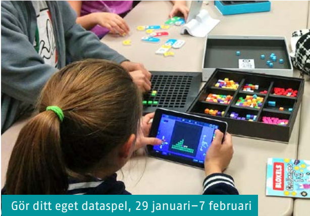
Gör ditt eget dataspel, 29 januari–7 februari