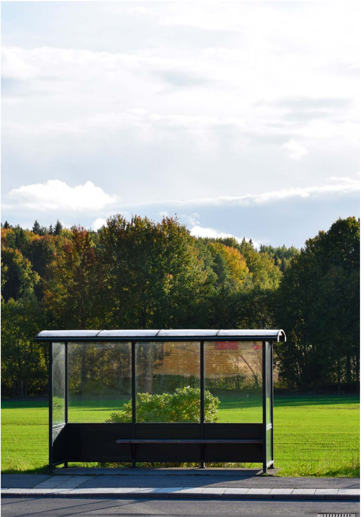
Bilden visar: Bushållålets Enhörna .